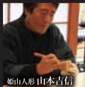
姫山人形 山本吉信