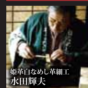
姫草白なめし革細工 水田輝夫