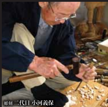
彫刻 二代目 小河義保